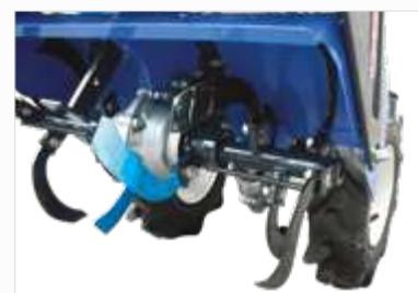
FREES VAN 55 CM In tegengestelde richting draaiende frezen