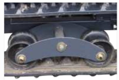
RUPS BANDEN OP PENDELEND DRAAGSTEL