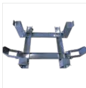
Draagstel opvangbak SXG3-CHAR