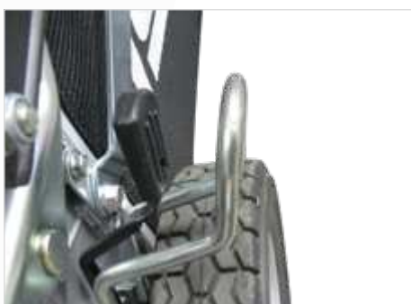
Regeling van de maaihogte via beschermde hendel