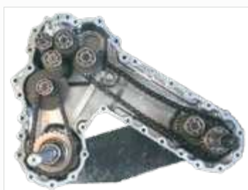
TRANSMISSIE MET KETTING