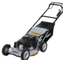
SW8210BHAE4HD (aluminium wielen)