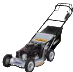
SW8210BAE4HD (aluminium wielen)