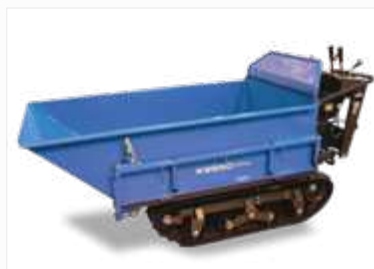
KIEPBAK (verkrijgbaar voor de 2 types)