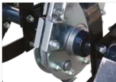
MET BOUTEN BEVESTIGDE MESSEN Met bouten bevestigde as in aluminium met beschermplaat