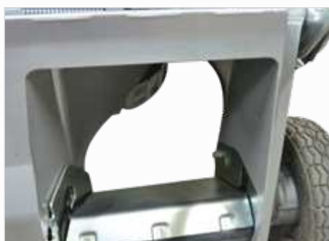
Ruim bemeten afvoerkanaal voor uitstekende grasopvang

De modellen SW8210BRE, BRAE en BRAEHD lopen op 2 wielen vooraan en een stalen wals achteraan om een mooi streep patroon in uw gazon te trekken. Alle modellen zonder wals achteraan en met een maaibreedte van 53 cm kunnen optioneel met een mulchset worden uitgerust.