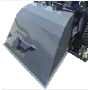
Deflector achteraan SXG3-DEFL-

Met een zitmaaier van ISEKI bent u zeker van een investering die heel het jaar door rendeert.