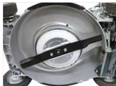
Aluminium maaidek met stalen versterking