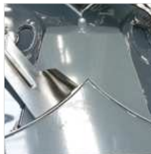
Mulchkit SXG3-KITMUL122 of SXG3-KITMUL137