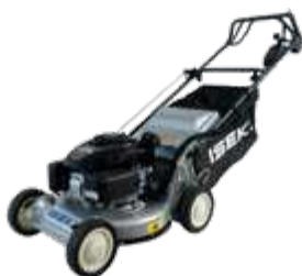
SW7193BE4 (kunststof wielen)