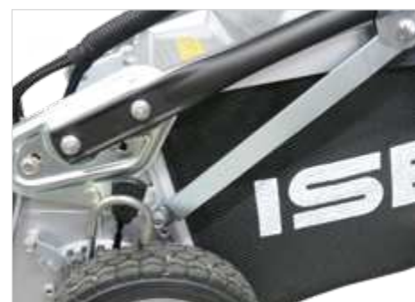
Verstevigde duwboom voor meer weerstand