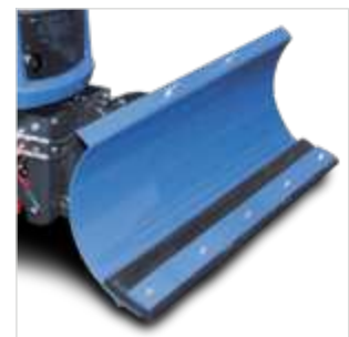
Sneeuwschuif 1,25 cm TLAN125/SXG