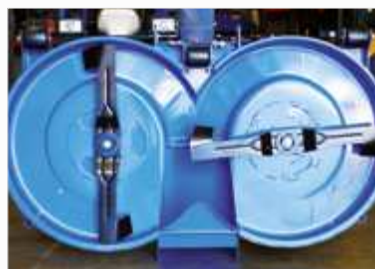
MAAIDEK MET GESYNCHRONISEERDE MESSEN