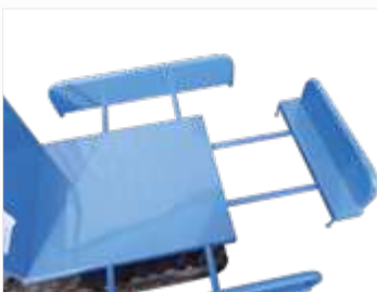
UITSCHUIFBARE ZIJPANELEN (bij XG35-H)