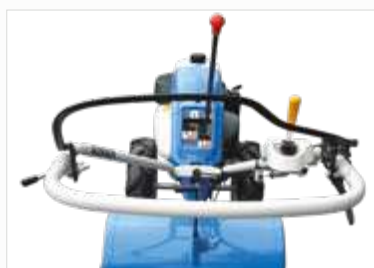
GOED BEREIKBARE BEDIENINGSTRUMENTEN OP HET STUUR