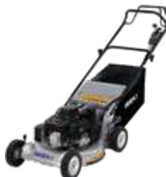
SW8210BE4 (kunststof wielen) SW8210BAE4 (aluminium wielen)