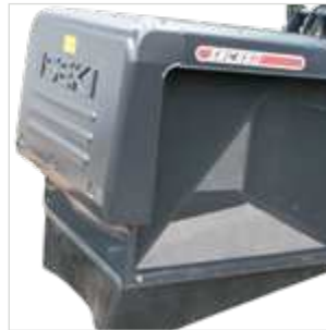
Verwijderbare bake KITDEFLSXG ou KITDEFLSXG600H