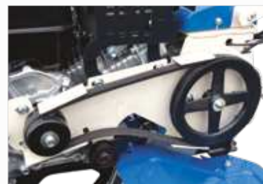
GIETIJZEREN RIEMSCHIJF Met riemgeleider